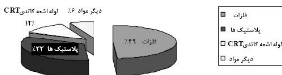
جدول ۲- مواد اصلی یافت شده در تجهیزات

بسیار مهم و تأثیرگذاری در فرایند بازیافت ایفا می‌کنند، زیرا بسیاری از اصول و روش‌های جداسازی مواد موجود در این تجهیزات بر پایه تفاوت در همین ۳ ویژگی ذکر شده است. از این رو در جدول (۳) مقادیر مربوط به چگالی و هدایت الکتریکی پاره‌ای از فلزات به‌کار رفته در ساخت تجهیزات الکترونیکی و الکترونیکی (EEE) به‌منظور مقایسه آورده شده است [۷].